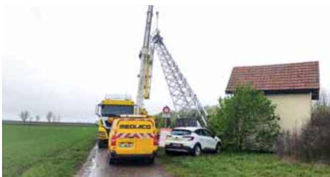
La nouvelle antenne-relais en cours de levage et d'installation.

Une antenne-relais de 42,25 mètres a été installée au lieu-dit Brunhurst, en bordure de l'autoroute. Elle est opérationnelle depuis le dernier trimestre 2024. Elle permet à la commune de Réguisheim de sortir de la zone blanche. Les services 3G et 4G des 4 opérateurs de téléphonie y sont implémentés. C'est un projet qui a mis trois ans à voir le jour, et qui vient répondre aux attentes de la population et des acteurs économiques.