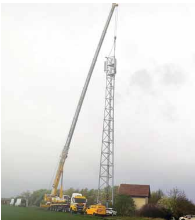
L'antenne de plus de 42 mètres de hauteur a été posée sur son socle au moyen d'une imposante grue

En effet, la question des problèmes ou de l'absence de réseaux dans le village et à ses abords était une problématique récurrente auprès des administrés, des secours ou encore des acteurs économiques. Une solution a pu être trouvée au travers de ce projet d'intérêt public initié et suivi pour Réguisheim par Éric Hassenfratz, adjoint au maire, en partenariat avec les services de l'État et l'opérateur référent, Free.